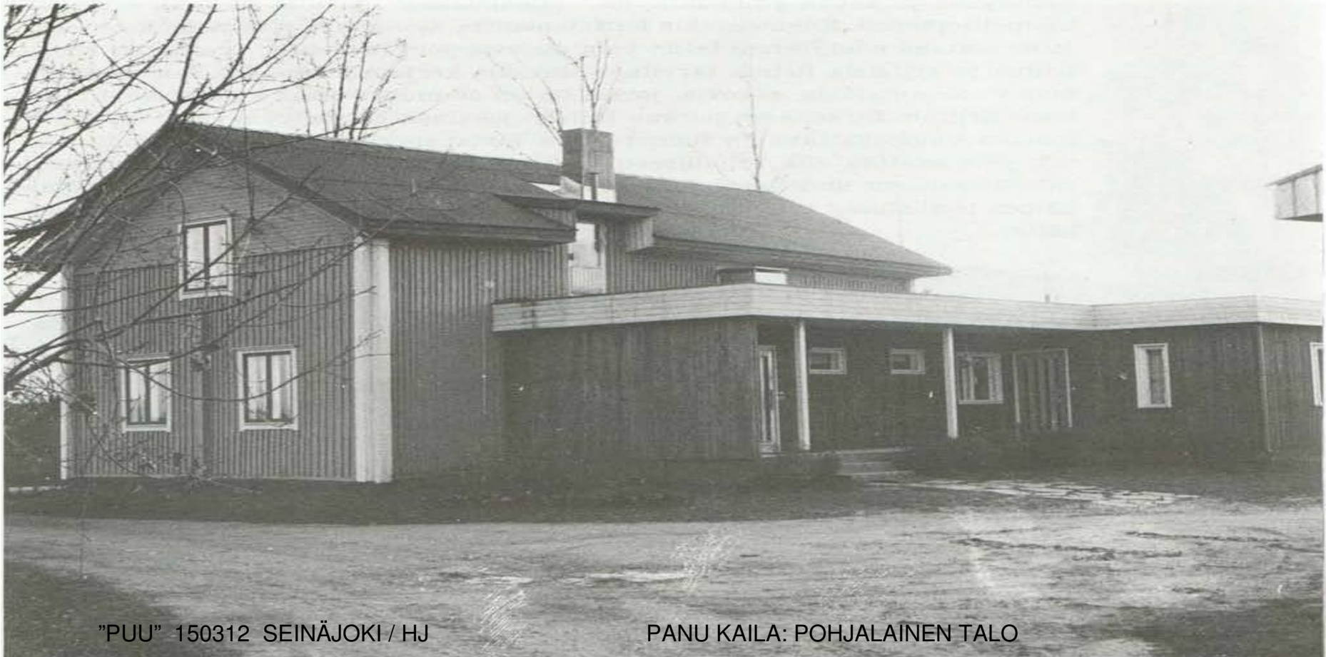
"PUU" 150312 SEINÄJOKI / HJ

Kuva 28. Usein kuulee sanottavan, että vanhaa ei saa jäljitellä vaan vanhaan liittyvän uuden rakentamisen on oltava sekä tekniikaltaan että muotokieleltään nykyaikaista. Ellei muuta vaadita, voi tulos olla tämän näköinen. Nykyikäisen jatko-osan liittäminen vanhaan taloon vaatii niin taitavaa suunnittelua, että epäonnistuminen on pikemmin sääntö kuin poikkeus. Kuvissa 24 ja 36 nähdään perinteelliseen tapaan laajennettuja taloja.