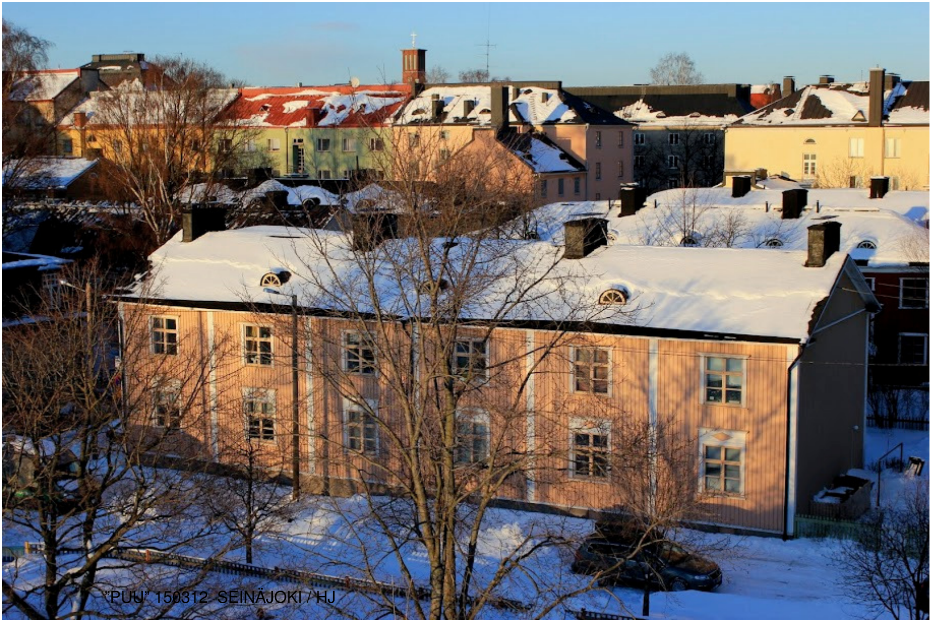
"PUU" 150312 SEINÄJOKI / HJ