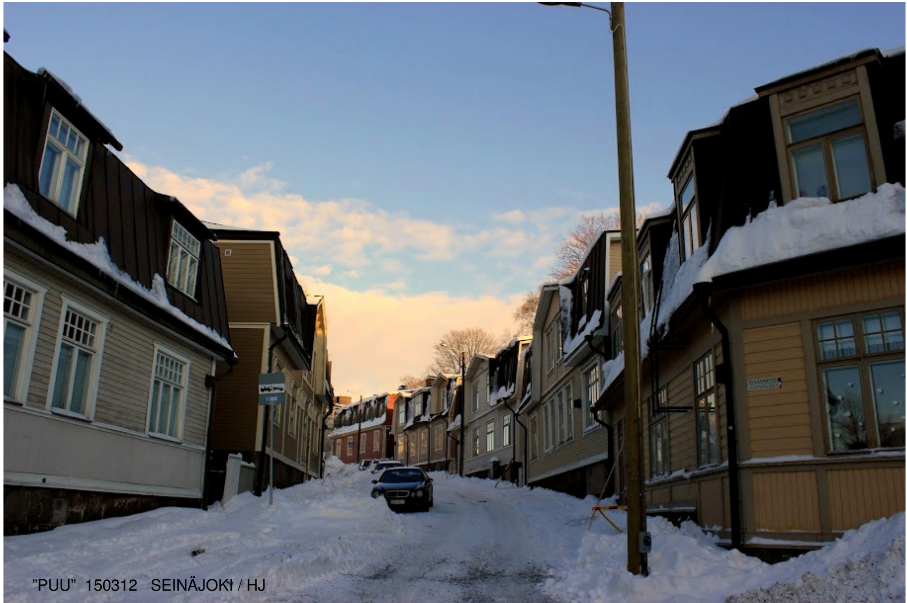
"PUU" 150312 SEINÄJOKI / HJ