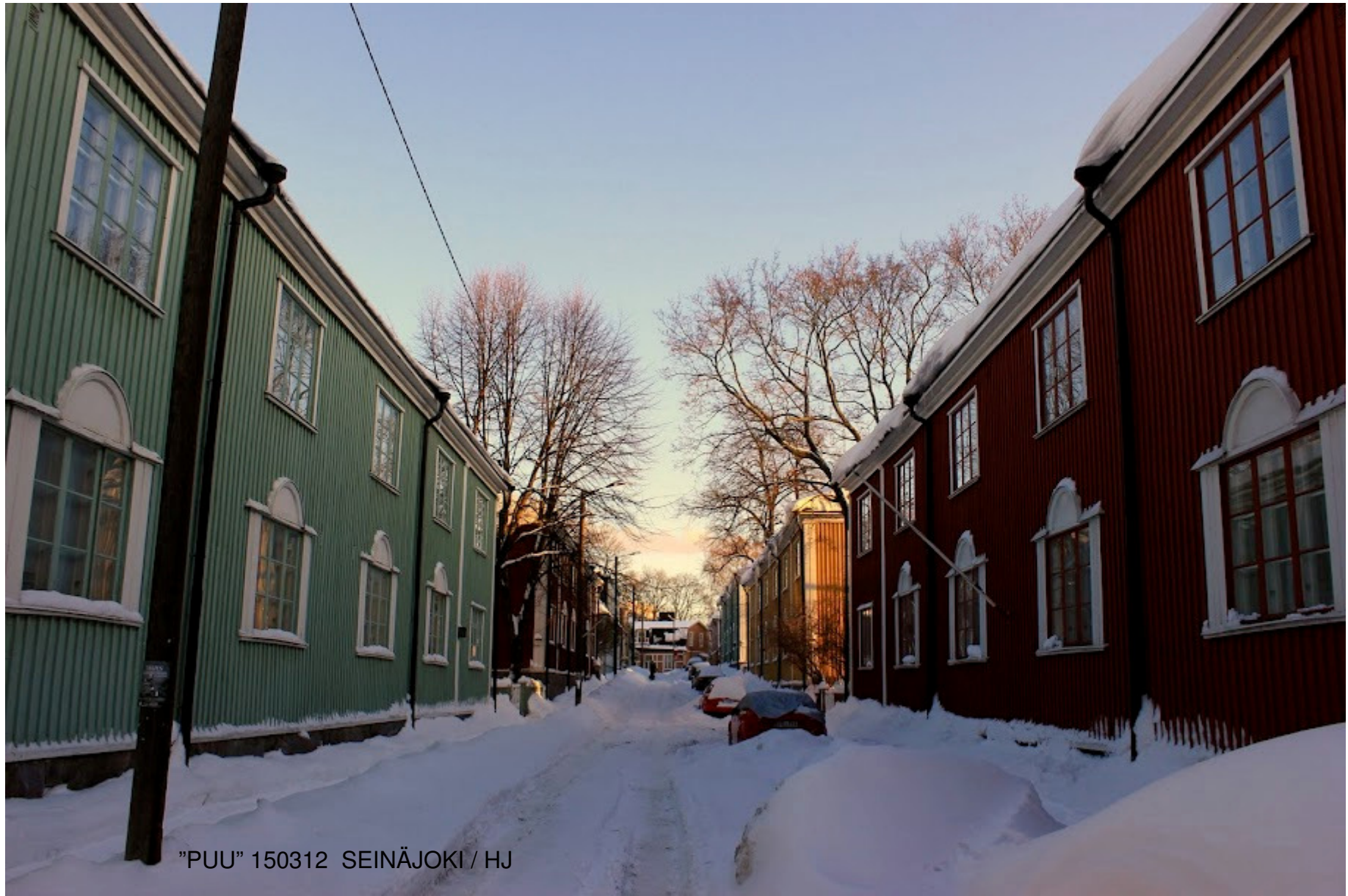
"PUU" 150312 SEINÄJOKI / HJ