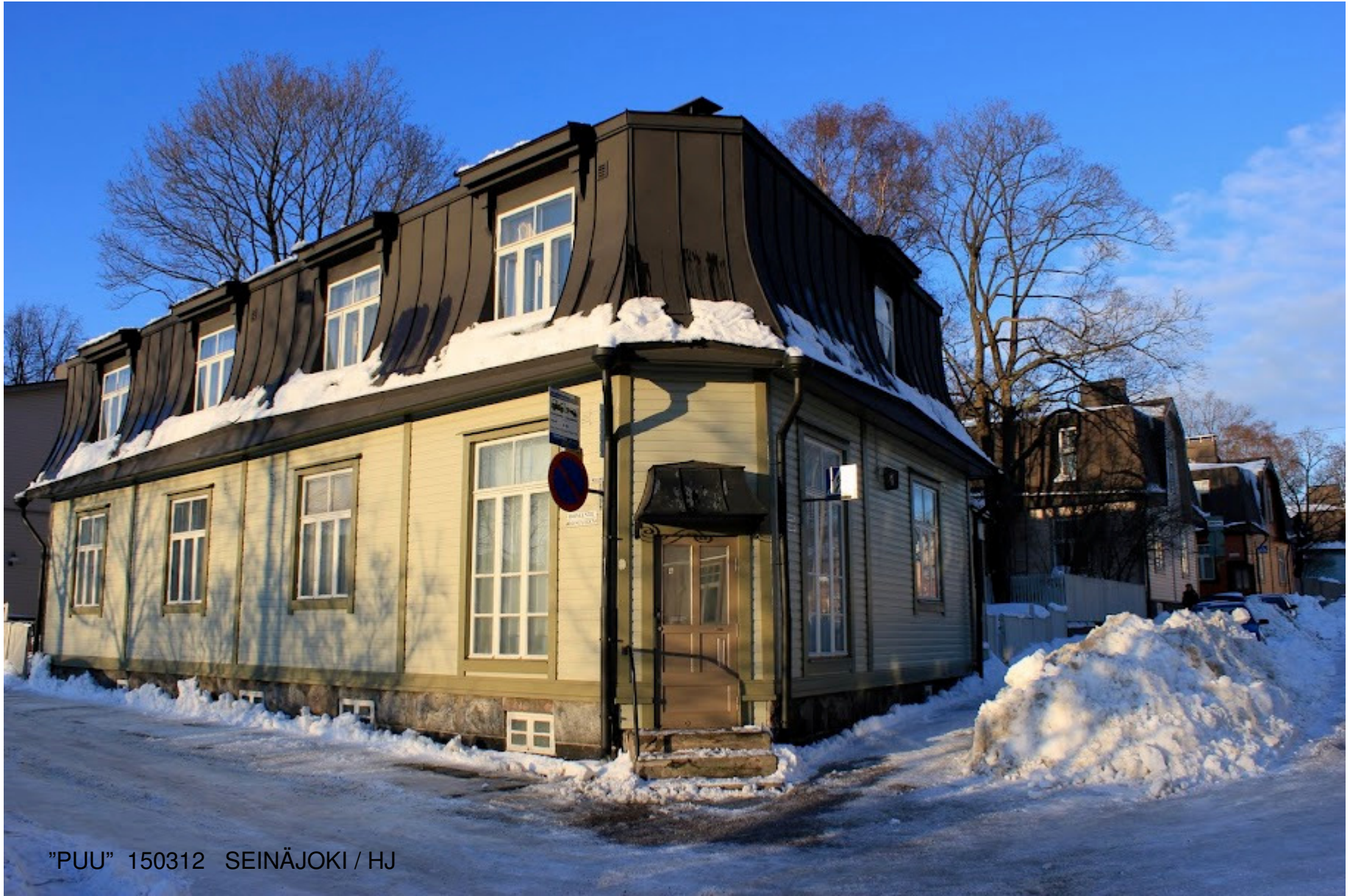
"PUU" 150312 SEINÄJOKI / HJ